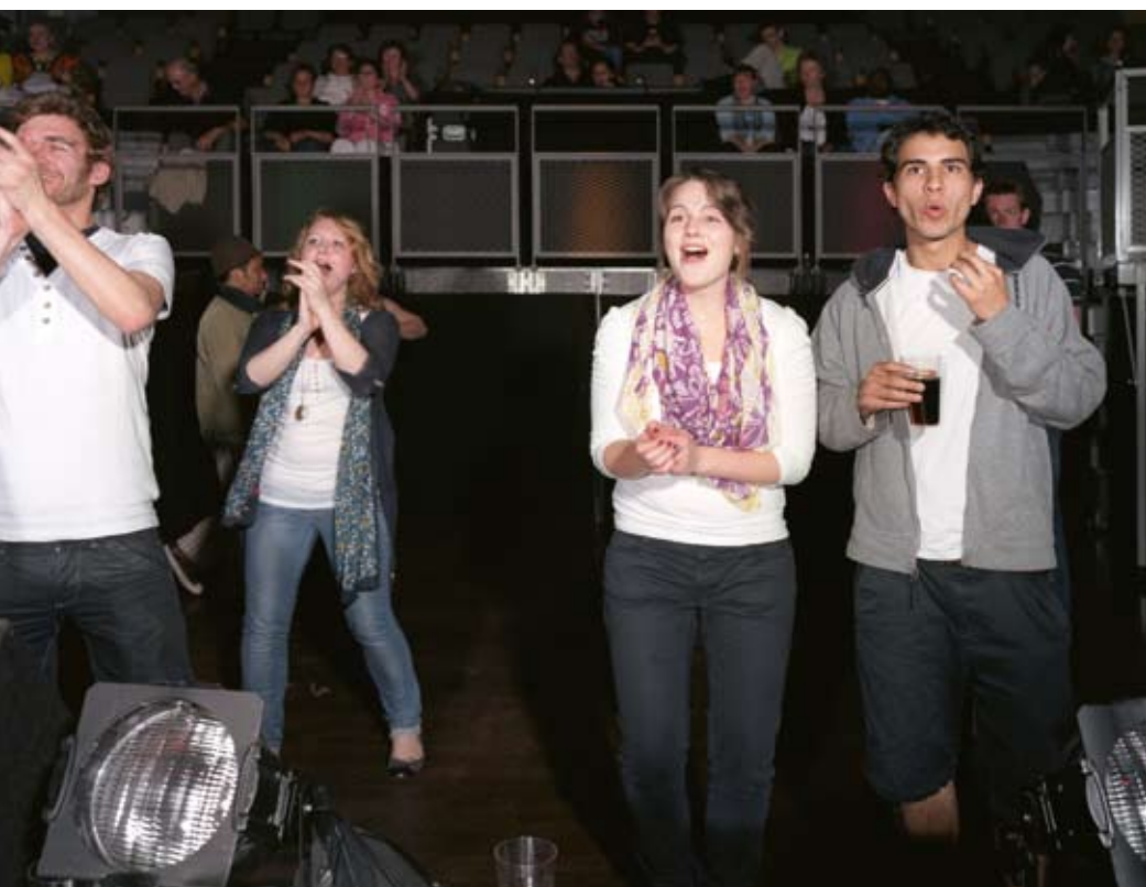
Beeld: Andrea Stultiens